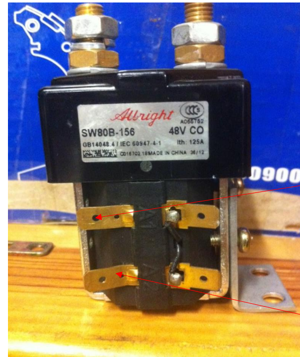
A1 Fil jaune