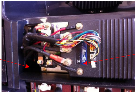
DIODE du Contrôleur Curtis